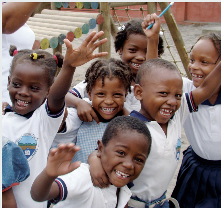
▶ Un grupo de niños jugando luego de clases.

De acuerdo a datos del Fondo de Las Naciones Unidas para la Infancia, en América Latina y el Caribe cada año más de 6 millones de niños y adolescentes sufren abusos severos, incluyendo el abandono, y cerca de 200 millones de niños padecen retrasos en el crecimiento y problemas de salud a causa de la mala nutrición en su primera infancia. El panorama en Colombia tampoco es alentador: cerca de 25.000 niños, niñas y adolescentes son explotados sexualmente según datos de la Procuraduría General de La Nación. Además, el Instituto Colombiano de Bienestar Familiar ha registrado en lo corrido de este año 2.496 denuncias por maltrato infantil.