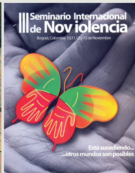
► Imagen del Seminario Noviolencia.