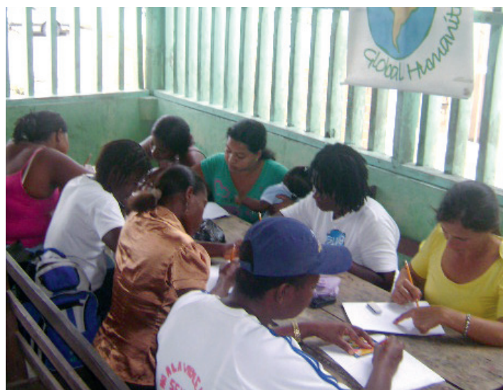
► Una madre y su bebé.