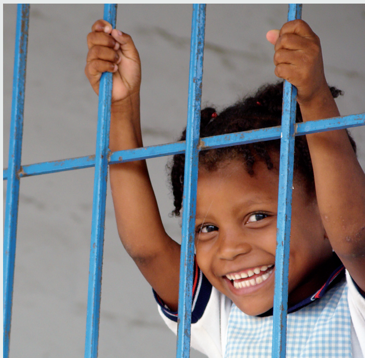
▶ Una niña sonriendo a través de una ventana.

Fernanda Luna Serna [Texto]