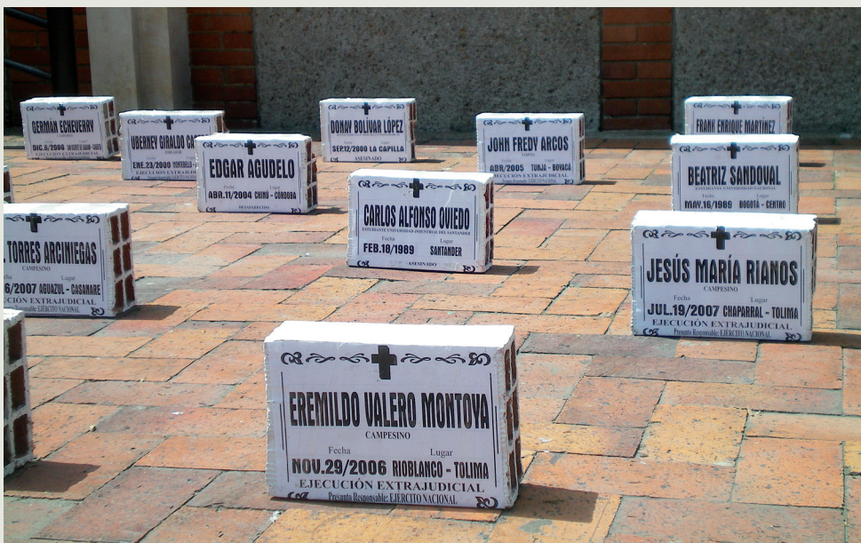
► Ladrillos de la memoria.

Fernanda Luna Serna [Texto] Global Humanitaria [Fotos]