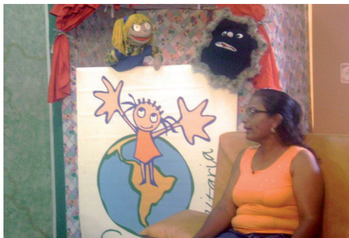
▲ Marionetas de Nutrilandia.

Nutrilandia enseña a los pequeños a explorar su entorno y a encontrar nuevas y divertidas formas de disfrutar el tiempo libre, en especial a través del ejercicio. El objetivo es que conozcan las capacidades de su cuerpo y aprendan a cuidar su salud física y mental. Alimentación en edad escolar, salud oral, grupos de alimentos,