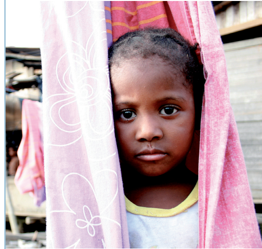
Global Humanitaria [Foto]

Reducir la violencia a través de la educación