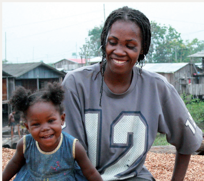
◉ Una madre jugando con su pequeña hija.

Fernanda Luna Serna [Texto]