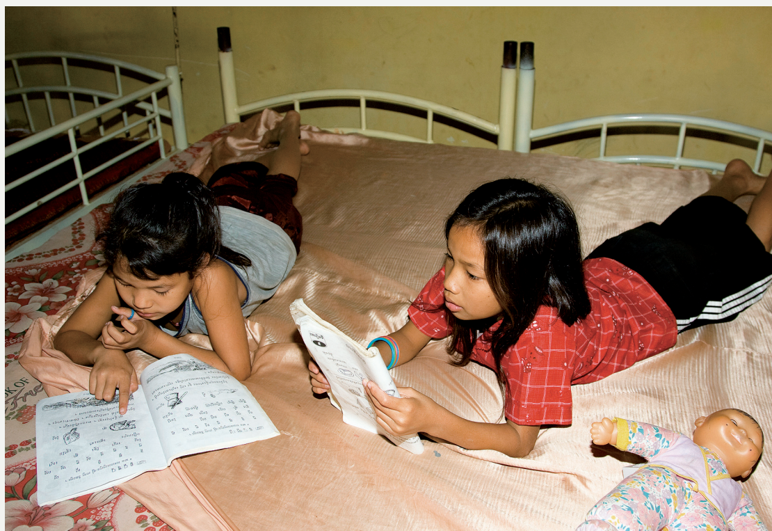
● Niñas leyendo en un hogar de Global Humanitaria en Camboya.

El pasado 4 de noviembre la ong española Asociación Protect se presentó oficialmente en Colombia con motivo del inicio de sus actividades. Protect trabajará de la mano de la Fundación Global Humanitaria para combatir el abuso sexual infantil en la ciudad de Cartagena de Indias.