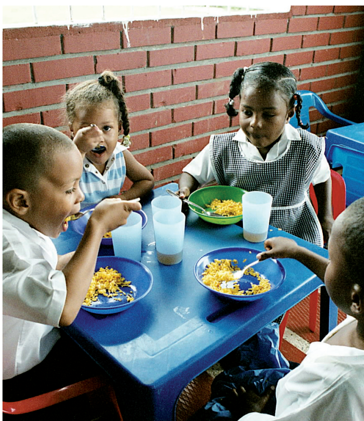
▲ Comedor en Mosquera. Global Humanitaria desarrolla programas de vigilancia alimentaria y nutricional a través de 47 comedores escolares.

El programa está presentado por 'muppets' que protagonizan un espacio divertido cuyo fin es sensibilizar a los niños sobre la importancia de una adecuada alimentación y nutrición, y los beneficios que trae adoptar hábitos de vida saludable.