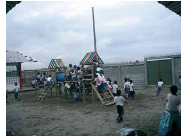
9 La municipalidad de Tumaco efectuó el cerramiento de la Institución Educativa Ciudadela Tumac, y Global Humanitaria se encargó del cerramiento de la zona de preescolar y de la construcción del parque infantil.

Asímismo relata con crudeza cómo la situación de inseguridad afectaba a su escuela: “los niños corrían el riesgo de ser atropellados por autos y motocicletas, como ocurrió en varias ocasiones. También había per-