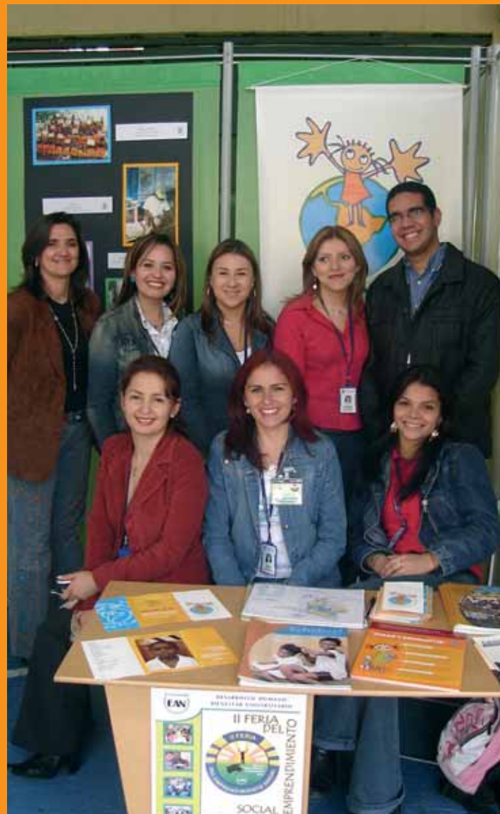
9 Miembros del equipo Global Humanitaria, difundieron la labor de la Fundación en la Universidad EAN de Bogotá.

En este espacio Global Humanitaria aprovechó para presentar sus proyectos y sensibilizar a los jóvenes acerca de la problemática social que padecen los niños y niñas del pacífico colombiano.