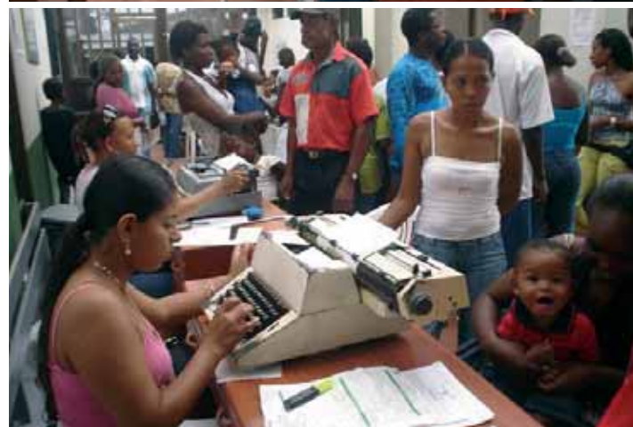
9 "El niño será inscrito inmediatamente después de su nacimiento y tendrá derecho a un nombre, a una nacionalidad, a conocer a sus padres y a ser cuidado por ellos..." (artículo 7º - Derechos de los Niños, Naciones Unidas- 1.989).

por el Estado. Por eso es frecuente encontrar familias enteras indocumentadas.